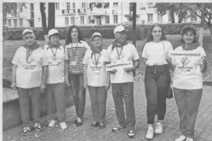
▲ Команда «Добротворцы».

Первыми с маршрутов вернулись команды «Орлята» гимназии № 6 и «Созвездие» Губкинского горно-политехнического колледжа. Студенты рассказали, что их маршрут пролегал по улице Лазарева. Ребята обновили информацию и сделали фото расположенных там памятников, фонтана и театра для детей и