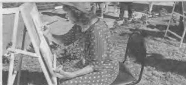
▲ Гости праздника убедились: жители центра по-настоящему творческие люди.